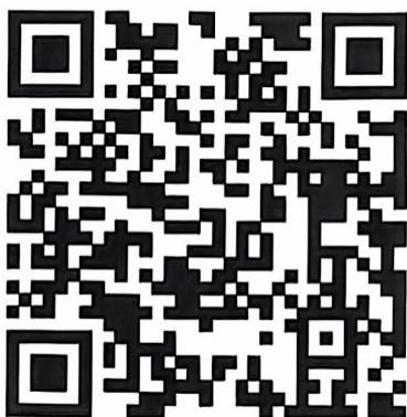
大会微网站二维码

参会主管部门及企业通过如下大会微网站二维码填报参会人员信息。会议系统开放时间 2024 年 11 月 22 日（星期五）10 时，报名截止时间 2024 年 11 月 26 日（星期二）17 时。